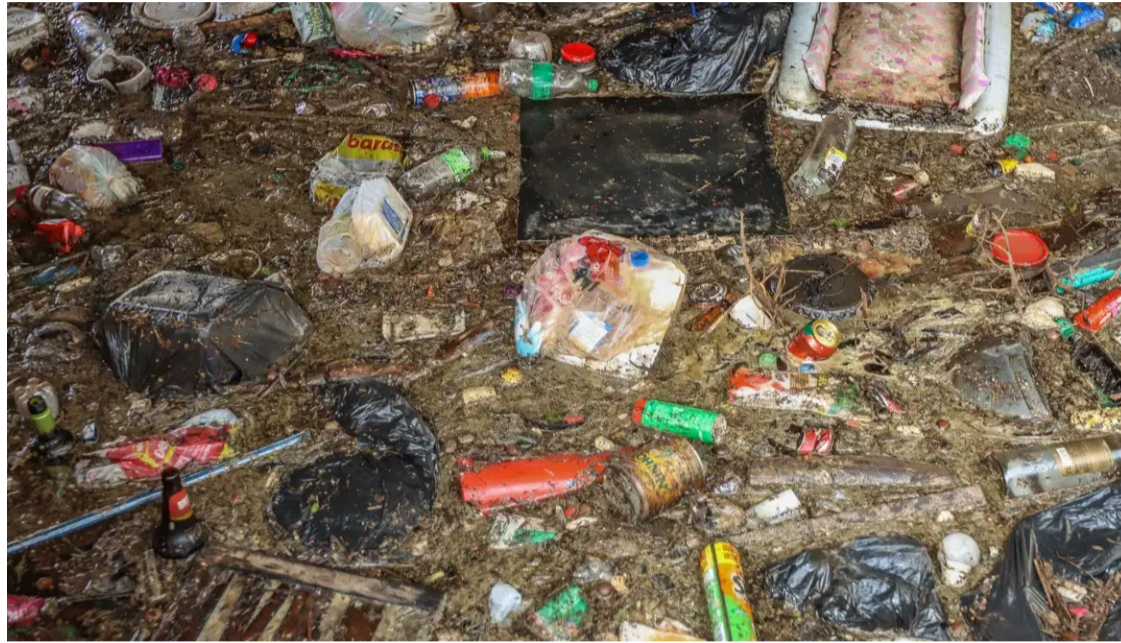
Bioplásticos, ao contrário dos plásticos sintéticos, não deixam resíduos que poluem o meio ambiente

Pesquisadores brasileiros desenvolveram bioplásticos que se degradam rapidamente quando compostados ou mesmo no ambiente