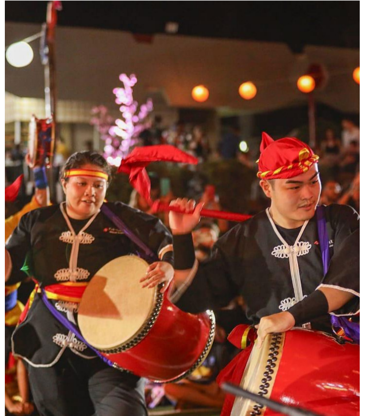
Tradicional no calendário goianiense, Bon Odori espera receber 8 mil pessoas no Clube Kaikan

Com cerca de 500 voluntários, a produção do Bon Odori envolve planejamento, patrocínios, apresentações, decorações e atendimento ao público. A Associação Nipo-Brasileira do Estado de Goiás (Kaikan), responsável pelo evento, não possui fins lucrativos. O festival conta com o apoio da prefeitura de Goiânia, por meio da Agência Municipal de Turismo, Eventos e Lazer (Agetul), e pretende divulgar a cultura japonesa, com a arrecadação sendo destinada à manutenção da associação e preservação das tradições.