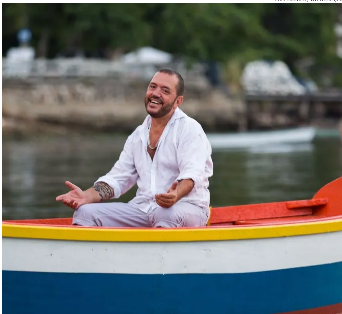
Sucesso na voz de Martinho: artista entendeu que britânica havia plagiado hit ‘Mulheres’