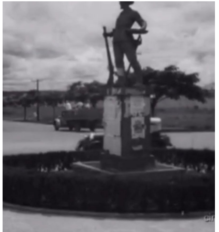
Goiânia em 1947: vídeo pode ser um dos mais antigos registros com imagens em movimento da nova capital

O vídeo pode ser visto no Instagram do presidente do IHGG (@mendoncajales), no próprio IHGG (@ihgggoias) e neste endereço no Youtube ( https://youtu.be/SiFeY9MtUs ), para quem não tem rede social.