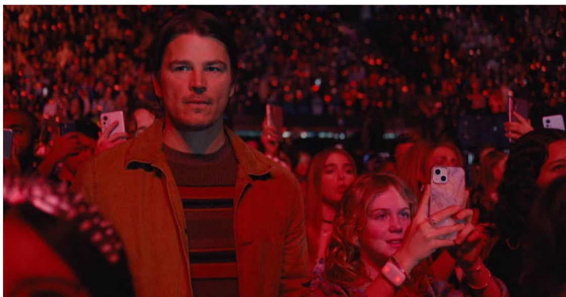
Pai e filha: história subjugada à mecânica da narrativa

realismo barato e brinca com uma encenação elaborada e de planos mirabolantes. Toda estratégia traçada pelo serial killer vira uma forma do longa explorar um lado diferente do show e, depois, do próprio protagonista.