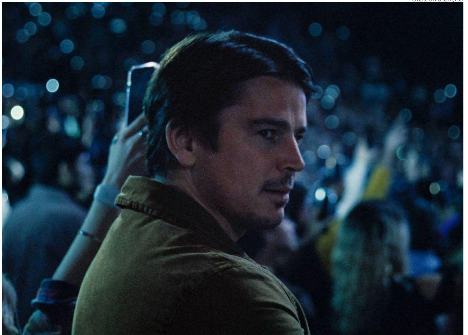
Josh Hartnett, ator: filme faz debate de relação entre pais e filhos algo hitchcockiana

O filme se diverte com o processo. Shyamalan evita o