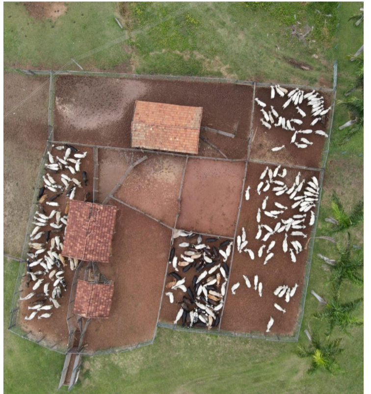
O crescimento da utilização de drones em operações aeroagrícolas ocorre em todas as áreas de produção

Equipamentos são utilizados em ações de fiscalização, monitoramento e controle de pragas e até vistorias de propriedades rurais para levantamento da quantidade de rebanho